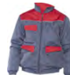
0205 Grigio / Rosso