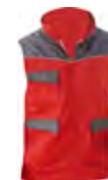
0502 Rosso / Grigio