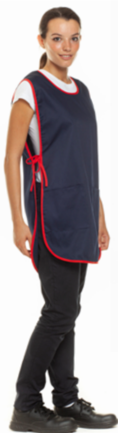
01/05 - Blu Navy / Rosso