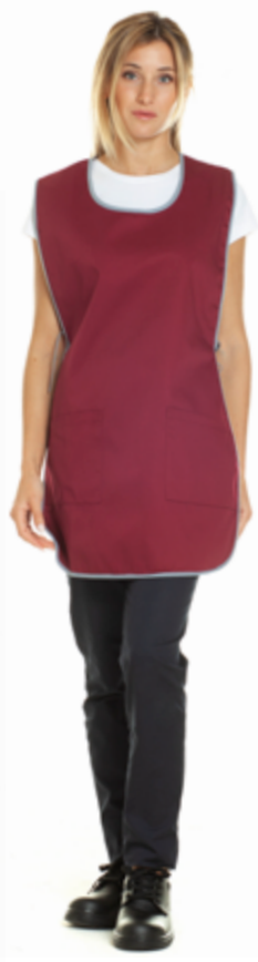
26/02 - Bordeaux / Grigio