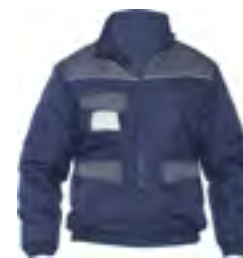
0102 Navy / Grigio