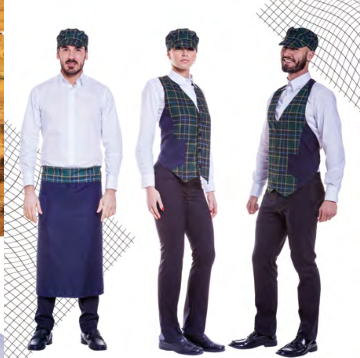
E023 Berretto Taglia Unica - Modello Unisex

Regolatore posteriore in velcro -Visiera morbida 100% Poliestere stampato in sublimazione Lavabile a 60 gradi - Produzione Italia