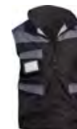
0802 Nero / Grigio