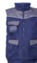
0102 Navy / Grigio