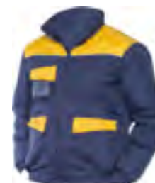
0106 Navy / Giallo