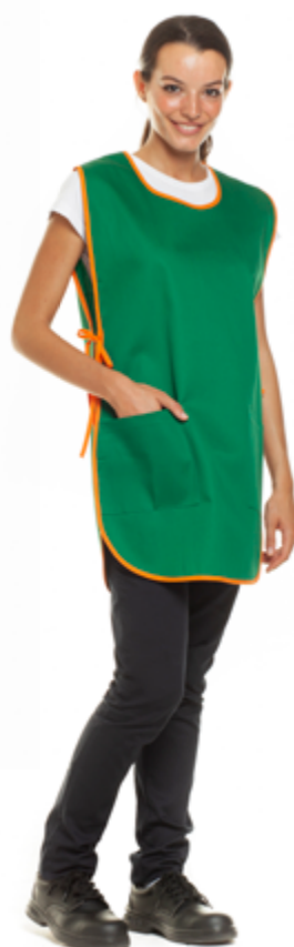
09/03 - Verde / Arancio