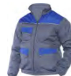
0204 Grigio / Royal