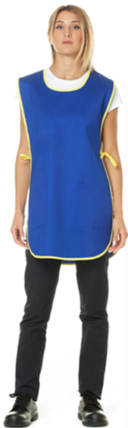
04/06 - Blu Royal/Giallo