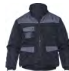
0802 Nero / Grigio