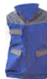
0402 Royal / Grigio