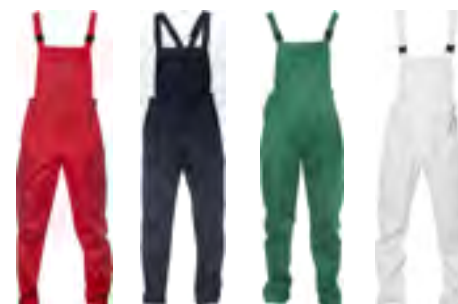
05 Rosso 08 Nero 09 Verde 11 Bianco