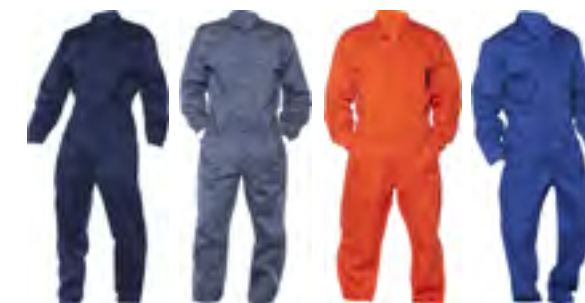
01 Navy 02 Grigio 03 Arancio 04 Royal