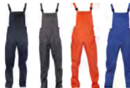
01 Navy 02 Grigio 03 Arancio 04 Royal