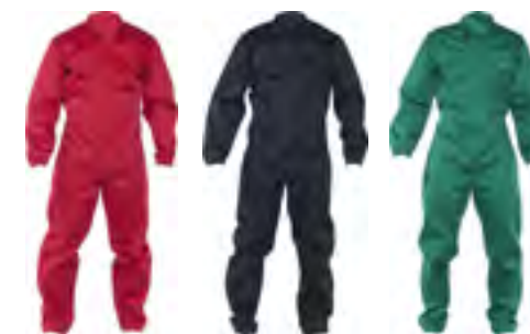
05 Rosso 08 Nero 09 Verde